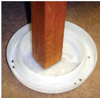
Dispositivo interceptor bajo la pata de un mueble.